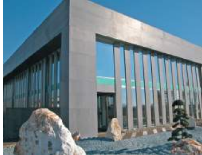
La sede di Microdevice a Flero (BS)

Hotel Supervisor è stato scelto anche da un lussuosissimo agriturismo immerso in un vecchio vigneto come il Vivere Suites and Rooms, dove design, tecnologia e natura si fondono in un'unica location, incorniciata dalle montagne di Arco a pochi chilometri dal Lago di Garda. Quattro suite e due junior suite, una zona wellness e piscina all'aperto, con un vigneto che incornicia il tutto. Nelle suite e nelle aree comuni è stato installato un impianto di automazione professionale per hotel (da non confondersi con la domotica), un sistema intelligente di controllo totale, che va dalla gestione degli accessi alla gestione del riscaldamento e raffrescamento a pannelli radianti, fino al controllo dell'umidità in tutti gli ambienti. La decisione di sostituire i pannelli con la nuova linea Life&Design ha conferito alla struttura un ulteriore tocco di design e tecnologia. Life&Design è una linea unica, di carattere, superiore a quelle attualmente disponibili sul mercato. I dettagli este-