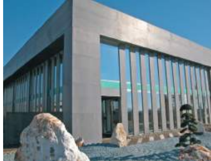
La sede di Microdevice a Flero (BS)

Hotel Supervisor è stato scelto anche da un lussuosissimo agriturismo-immerso in un vecchio vigneto come il Vivere Suites and Rooms, dove design, tecnologia e natura si fondono in un'unica location, incorniciata dalle montagne di Arco a pochi chilometri dal Lago di Garda. Quattro suite e due junior suite, una zona wellness e piscina all'aperto, con un vigneto che incornicia il tutto. Nelle suite e nelle aree comuni è stato installato un impianto di automazione professionale per hotel (da non confondersi con la domotica), un sistema intelligente di controllo totale, che va dalla gestione degli accessi alla gestione del riscaldamento e raffrescamento a pannelli radianti, fino al controllo dell'umidità in tutti gli ambienti. La decisione di sostituire i pannelli con la nuova linea Life&Design ha conferito alla struttura un ulteriore tocco di design e tecnologia. Life&Design è una linea unica, di carattere, superiore a quelle attualmente disponibili sul mercato. I dettagli este-