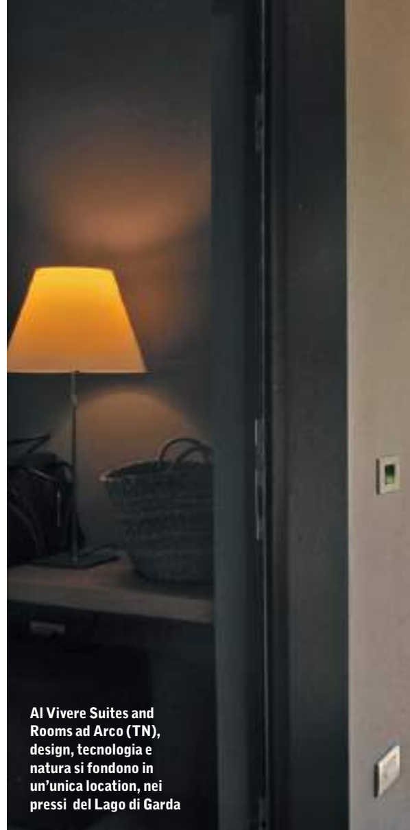
Al Vivere Suites and Rooms ad Arco (TN), design, tecnologia e natura si fondono in un'unica location, nei pressi del Lago di Garda