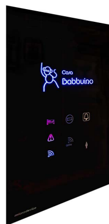
Linea Your Light